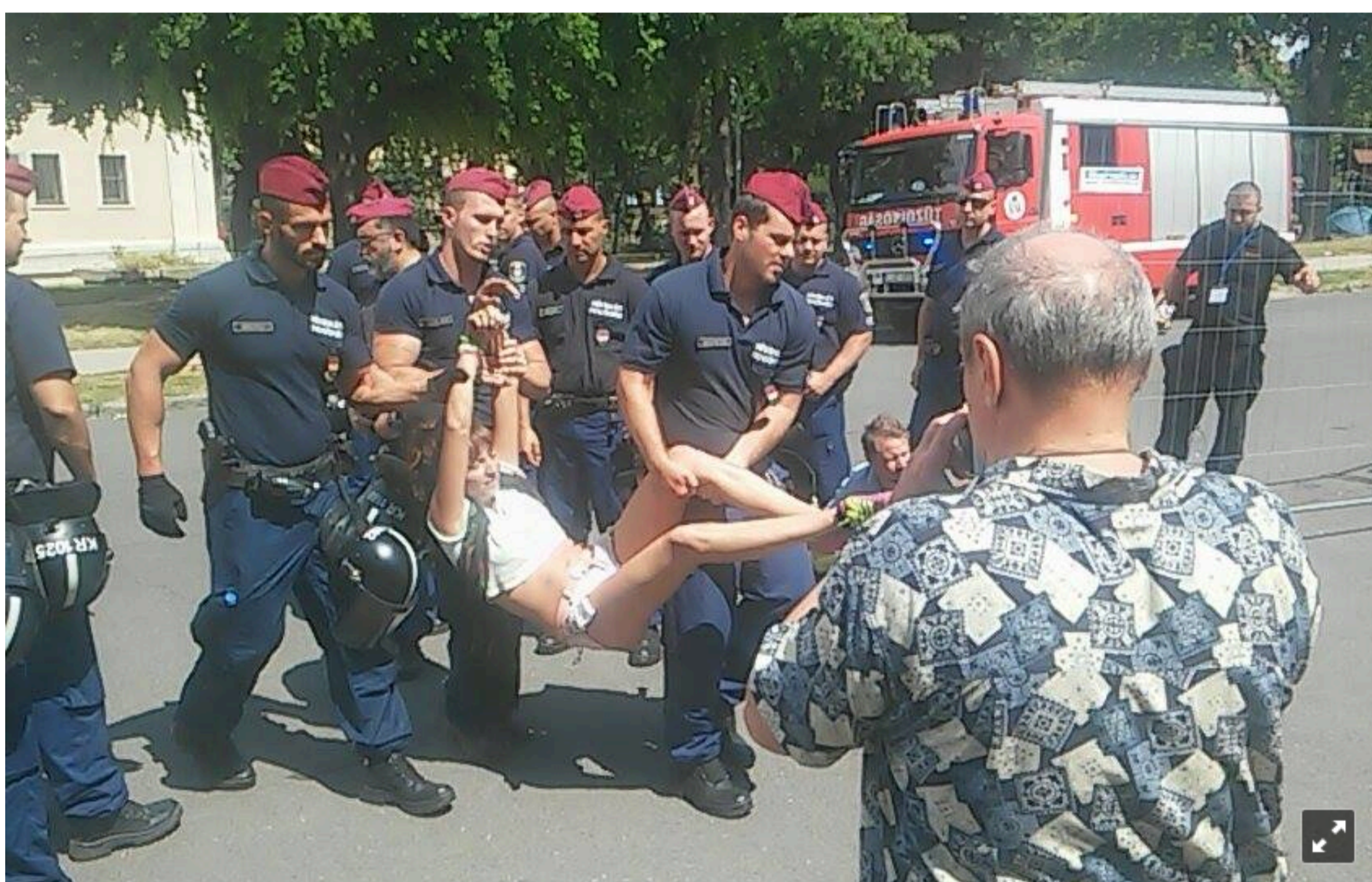
14.50 - Mostanra csak egyetlen aktivista maradt már, a múzeum kéményén, most őt próbálják mel lehozni onnan.