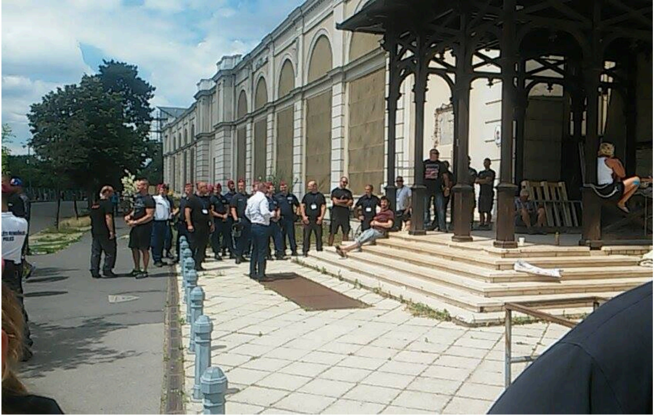
Aktivisták láncolták magukat az ablakokra: