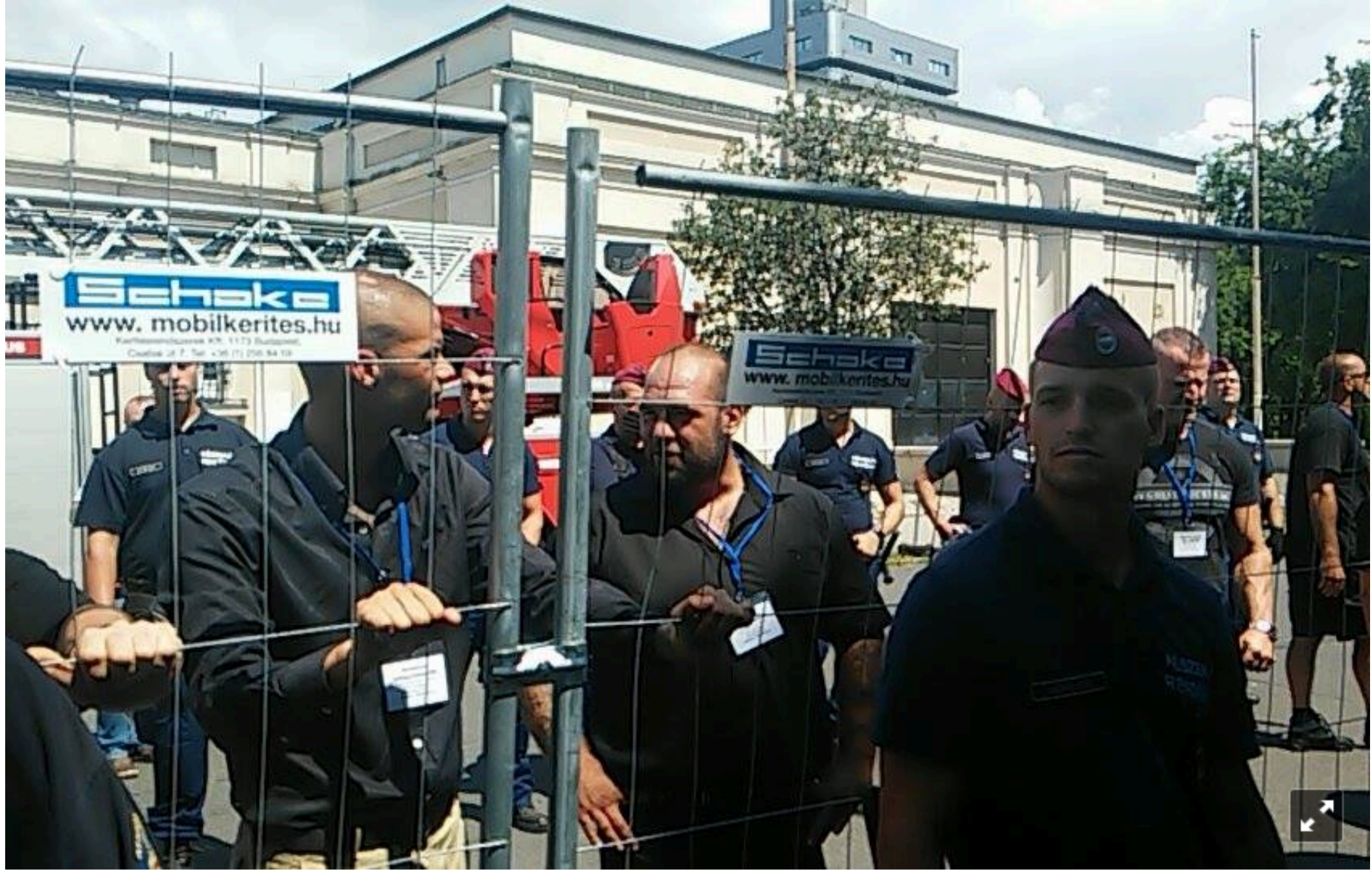
14.15 - A múzeum közvetlen környéke kiürült a kordonok miatt, csak a rendőrök, biztonságiak és az ablakrácsokhoz láncolt aktivisták maradtak. A kordonon kívül persze továbbra is sokan ácsorognak, köztük vannak olyan Fidesz-szavazók is, akik ellenzik a Liget-projektet, legalábbis ez derül ki tudósítónk ottani beszélgetéseiből.