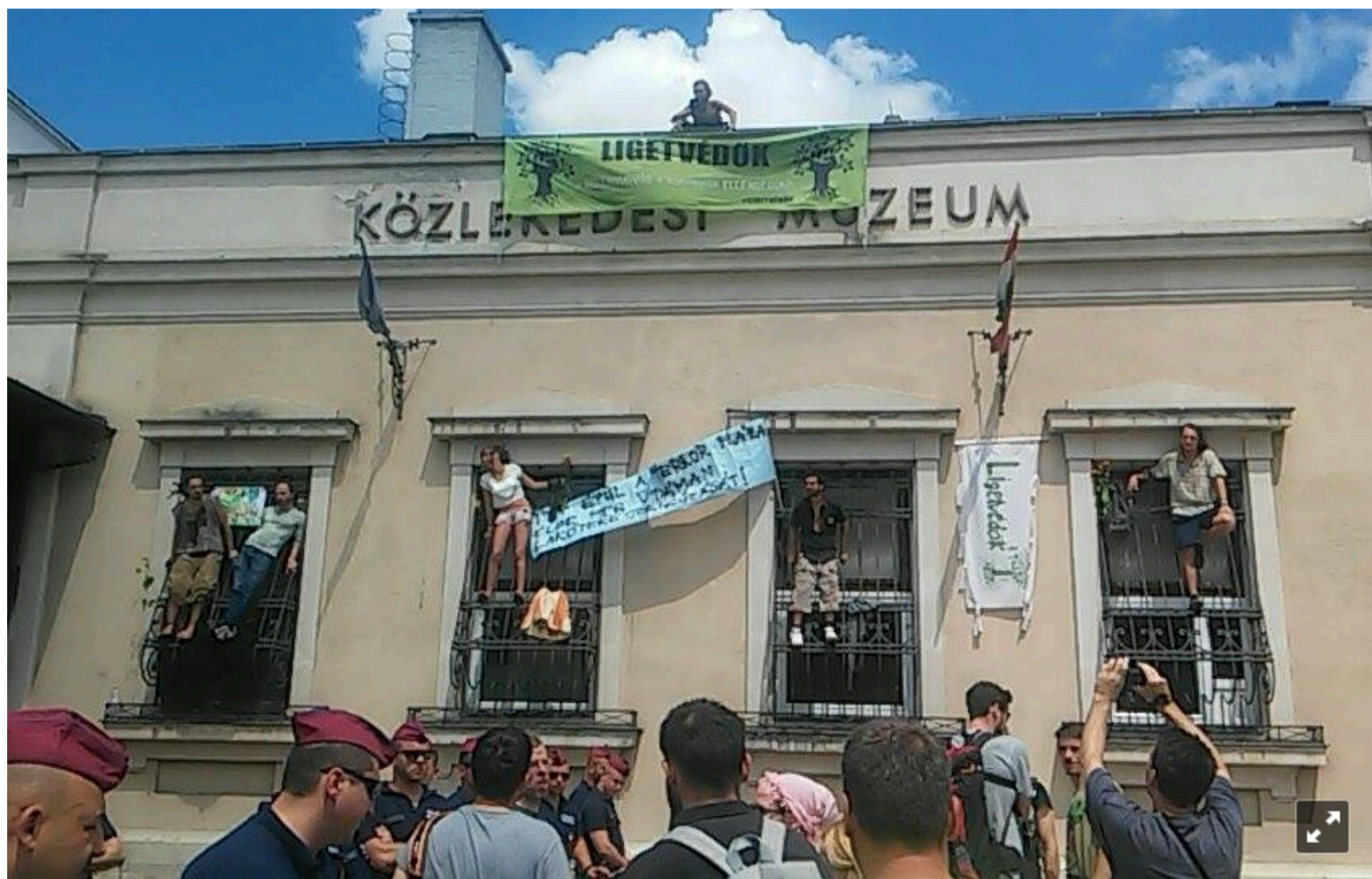
13.38 - Most viszi el a rendőrség az utolsó aktivistákat a múzeum bejáratától. Ők is le voltak láncolva.